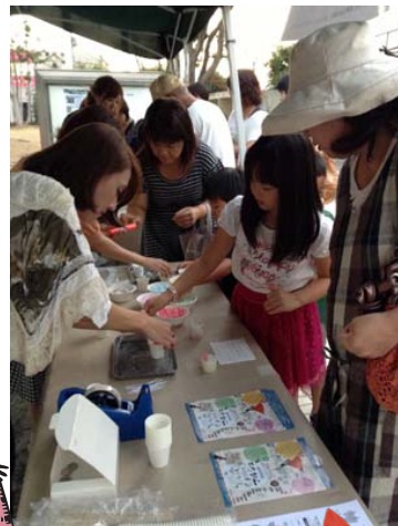
スタッフと一緒にキャンドルを作る子供たち。

私達手づくりマルシェも参加し、子供達には、復興を願うキャンドルを作ってもらいました。手づくりマルシェの受けたインタビューも、後日ラジオ福島さんで放送していただきましたよ。出演した松崎しげるさんの、素敵な歌声と共に…(*^^*)