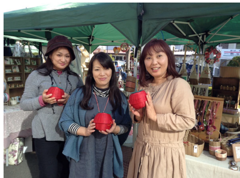
お写真からも、そのセンスの良さが伝わってきます！

これからも楽しい仲間と手づくり Shop をたくさんやって、お客様とのふれあいを大切にしていきたいです。